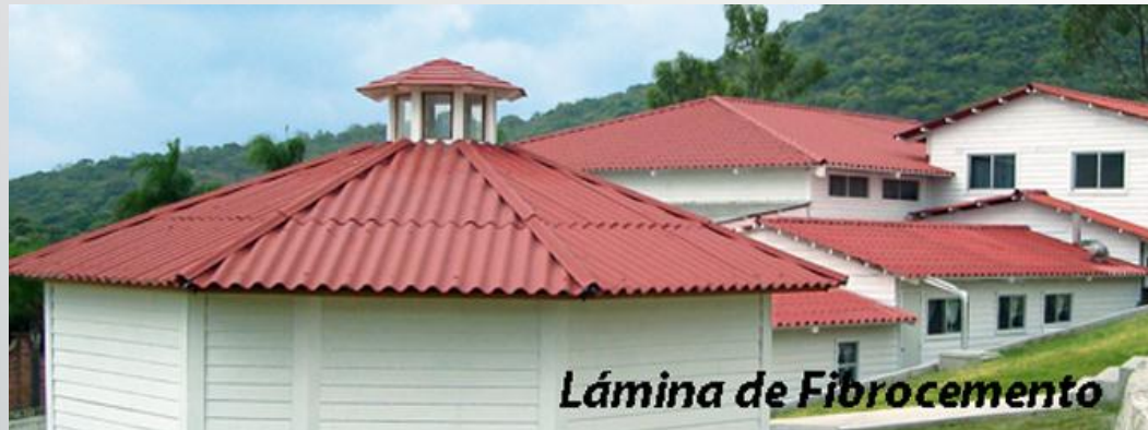
Lámina de Fibrocemento