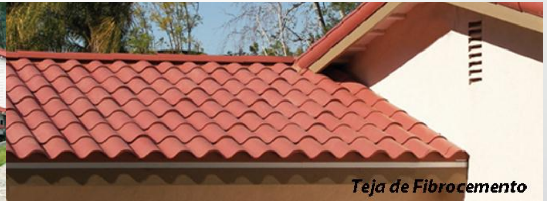
Teja de Fibrocemento