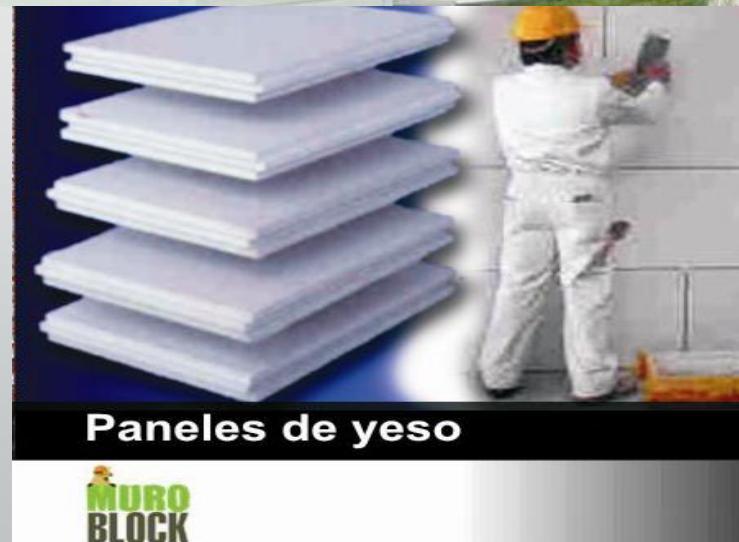
Paneles de yeso