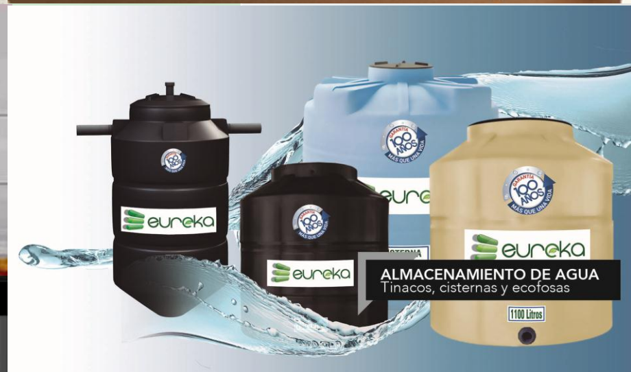
ALMACENAMIENTO DE AGUA Tinacos, cisternas y ecofosas

Click en foto del producto para mayor información.